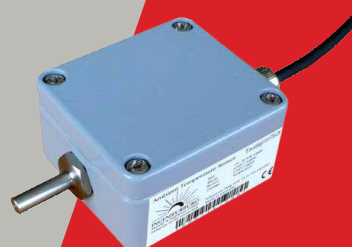
► Omgevings temperatuur sensor