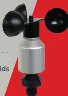
► Wind snelheids sensor