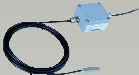
► Paneel temperatuur sensor